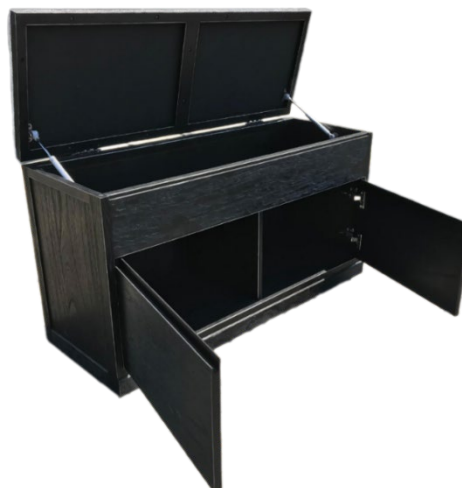
Gambar 3. Hasil Realisasi dari Gambar Kerja Bench Storage Figure 3. The Actual Result of The Bench Storage Working Drawing